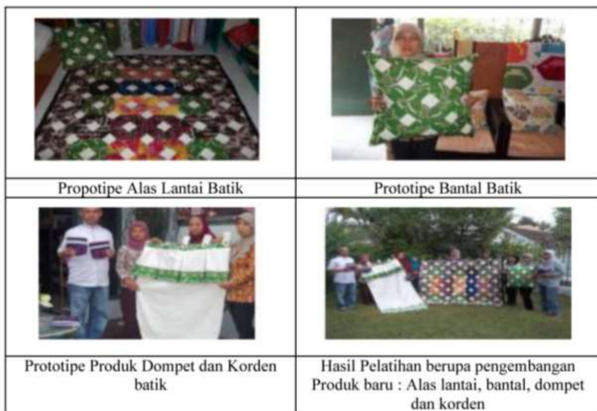
Tabel 3. Prototipe Produk Baru Batik Jono