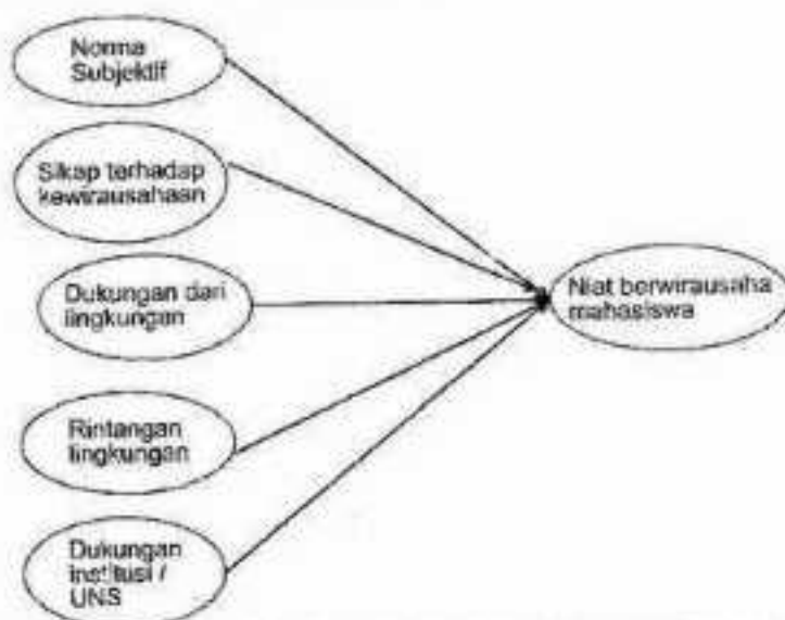
Gambar 1. Model yang Diusulkan untuk Niat Berwirausaha Mahasiswa UNS

Berdasarkan uraian alasan-alasan diatas maka model TPB yang dimodifikasi dengan hasil studi Schwarz et al. , (2009), Wu, S. et al. , (2008); dan Engle RL, et al. , (2008) yang akan diuji dalam penelitian tentang niat berwirausaha mahasiswa UNS ini dapat disusun kerangka dasar seperti tertera pada gambar 1 sebagai berikut :